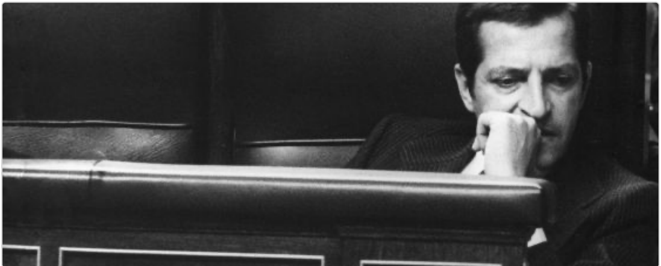
Adolfo Suárez permanece solo en el banco azul mientras el resto de diputados se protege.