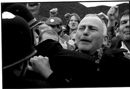
HUELGA DE 1984

Para entender por qué el padre de Billy está tan enfadado, hay que entender qué estaba pasando fuera del gimnasio de boxeo.