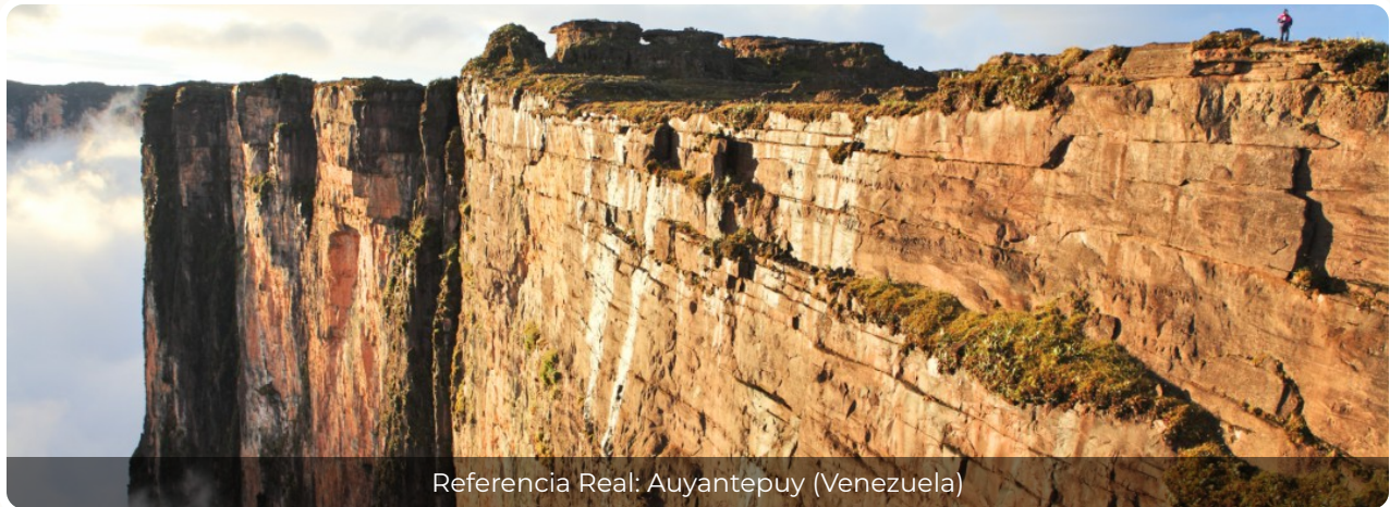
Referencia Real: Auyantepuy (Venezuela)